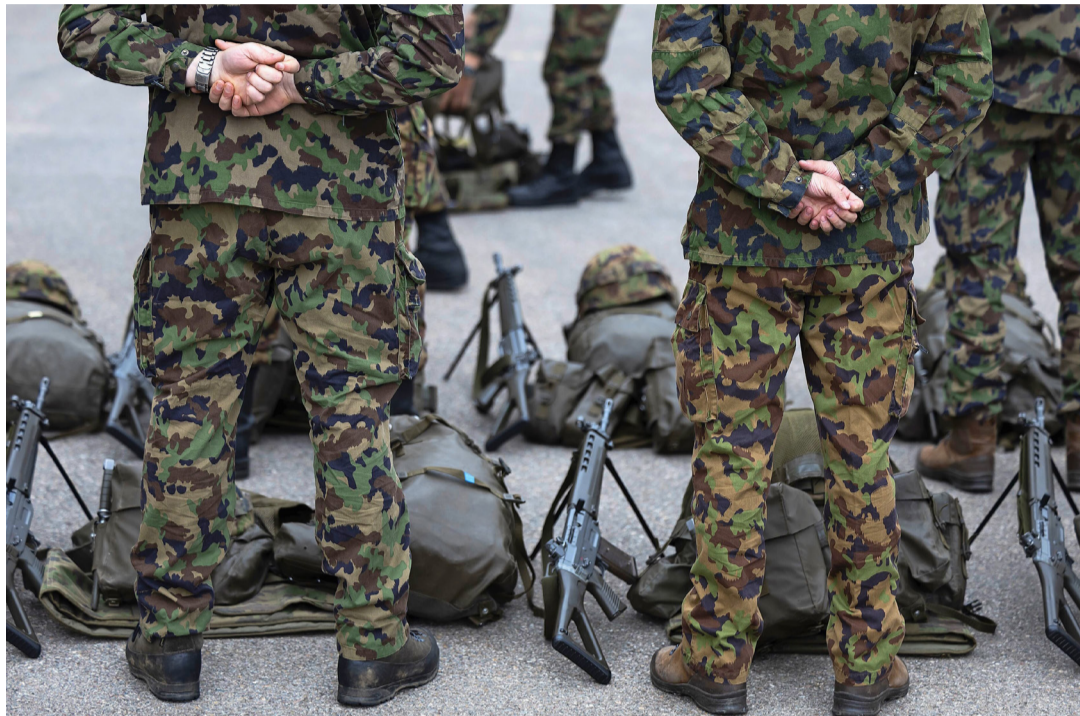
Nach der knappen Abstimmung über das Zivildienstgesetz wird aus der Armee Selbstkritik laut: WK-Soldaten auf dem Waffenplatz in Bure JU.

Doch die Landesregierung musste selbst einräumen, dass «keine zuverlässige Aussage über die tatsächlichen Auswirkungen möglich» sei. Der «Tages-Anzeiger» hatte errechnet, dass die Massnahmen nur für rund 1200 Wechselwillige einen Übertritt zum Zivildienst tatsächlich spürbar unattraktiver machen.