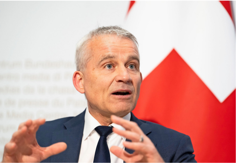
Bundesrat Beat Jans freut sich über die hohe Stimmbeteiligung. Die Freude über das deutliche Nein zeigte er indes nicht.