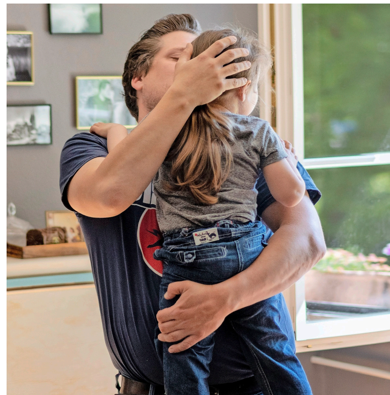
Bei den Abstimmungen in Genf wurde der Elternurlaub von 24 Wochen mit 57,9 Prozent angenommen.

Sprich: Zwei Wochen können Genfer Eltern künftig untereinander aufteilen. Pikant daran: Ausgerechnet die Linke lehnte die Vorlage ab. Das aber nicht, weil sie gegen einen Elternurlaub ist. Sondern weil ihnen die nun vom Volk angenommene Variante als zu wenig fortschrittlich erschien. Die Bürgerlichen (ausser der SVP) sowie die Kantonsregierung und das Kantonsparlament stellten sich derweil hinter den GLP-Vorstoss. Genf erhält