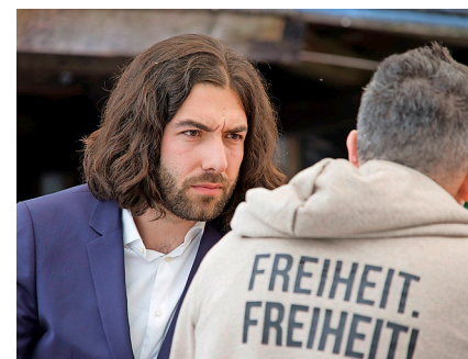
Auch beim dritten Mal sind die Massnahmen-skeptiker gescheitert. BILD KEY

Doch nun setzt es für die Gegner des Covid-Gesetzes die dritte deutliche Niederlage ab. 61,9 Prozent haben die Vorlage am Sonntag angenommen. Bei den ersten beiden Abstimmungen (im Juni