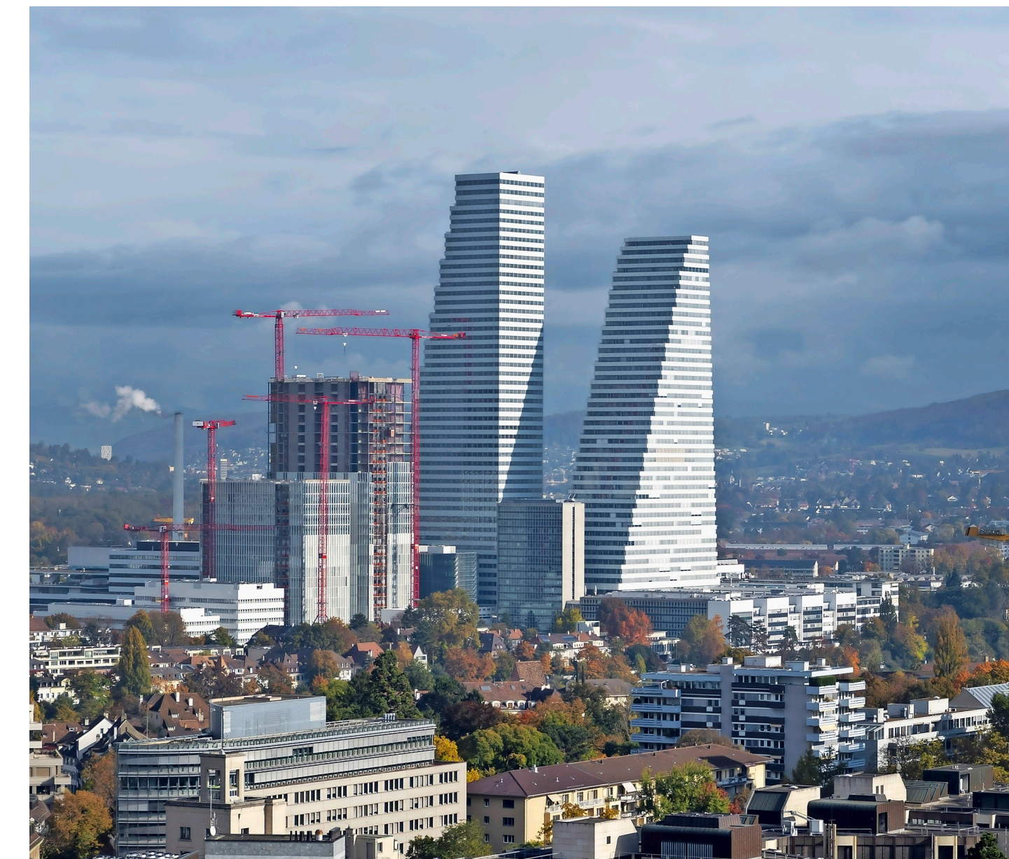
Basel gehört zu den grossen Profiteuren der Steuerreform.

Angedacht sind soziale Massnahmen wie der Ausbau der Kinderbetreuung oder Investitionen in Energie, Verkehr und Forschung sowie Beihilfen an Unternehmen für Forschung und Entwicklung. Zug kann