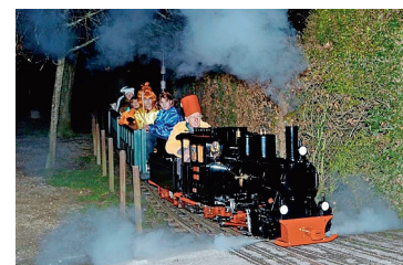
Märlizug der Liliputbahn.

STEIN AM RHEIN An den Adventswochenenden vom 7./8., 14./15., 21./22. Dezember dampft auch dieses Jahr der Märlizug der Steiner Liliputbahn zwischen 13 und 17 Uhr vom Bahnhöfli durch den Steiner Stadtgarten, dem Rhein entlang hinunter zum Depot und zurück.