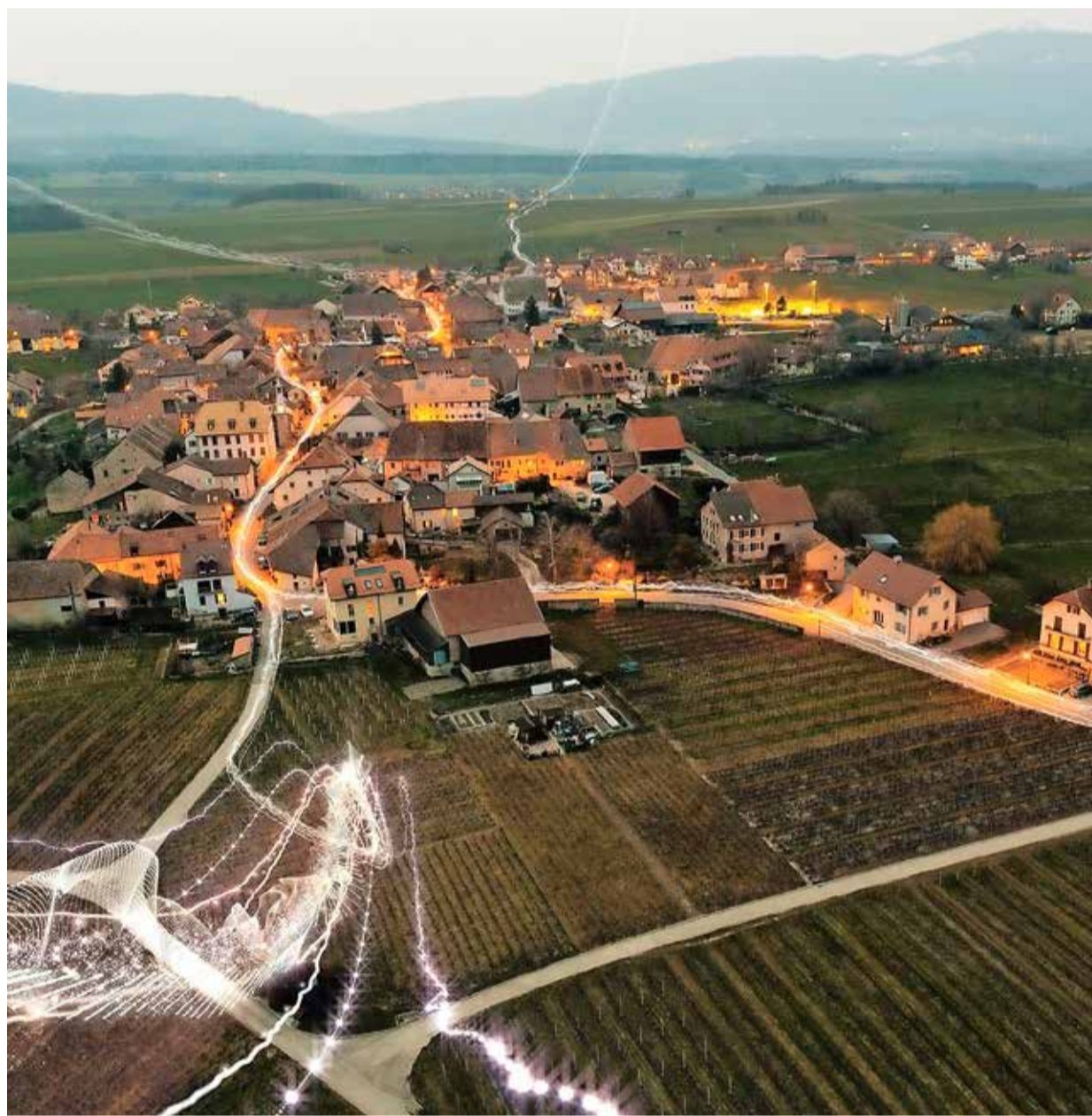
Bis Ende 2021 sollen alle Schweizer Gemeinden an das Glasfasernetz der Swisscom angeschlossen sein.

Die Karte fördert aber auch zutage, dass etwa Schleithelm, Beggingen oder Merishausen nicht an die 5G-Technologie angeschlossen sind. Im laufenden Jahr solle das Netz jedoch weiter ver-